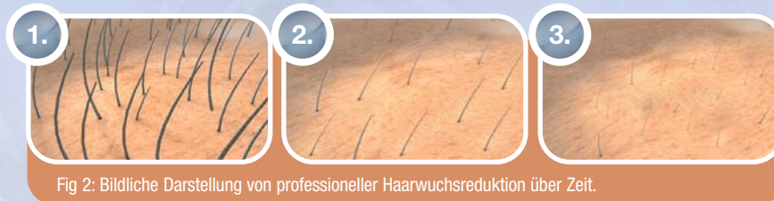
Fig 2: Bildliche Darstellung von professioneller Haarwuchsreduktion über Zeit.

Durch die Enzymaktivität von EpilaDerm® wird den Haarfollikeln langfristig die Wachstumsgrundlage soweit entzogen, dass sich die haarfreie Zeit in der Regel verlängert und der Haarwuchs verringert wird.